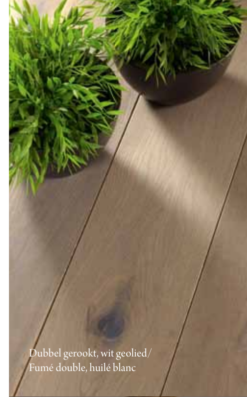
Dubbel gerookt, wit geolied/ Fumé double, huilé blanc

Un revêtement de sol nécessite peu d'entretien: pour l'entretien journalier, un coup d'aspirateur suffit. Un plancher souillé peut être nettoyé à l'aide d'une tissu humide. En fonction de l'intensité du passage sur le sol, le plancher devra être huilé plusieurs fois par an avec l'huile entretien du programme 'Natural Oil Care'. Demandez à votre distributeur de vous remettre les instructions de pose et d'entretien et les conditions de garantie.