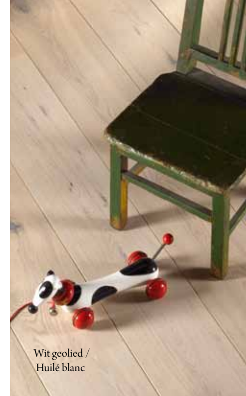
Wit geolied / Huilé blanc

Un revêtement de sol bois est un produit naturel, robuste et plein de caractère. La collection Character vit et apporte une ambiance dans votre intérieur. Vous avez le choix entre chêne non-traité, fumé ou fumé double. Des revêtements de sol sont traités avec différentes teintes d'huile, ou aux choix, non-traités, ce qui vous permette de déterminer le choix de l'huile.