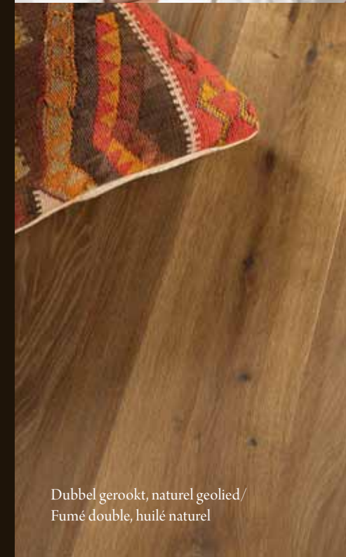
Dubbel gerookt, naturel geolied/ Fumé double, huilé naturel