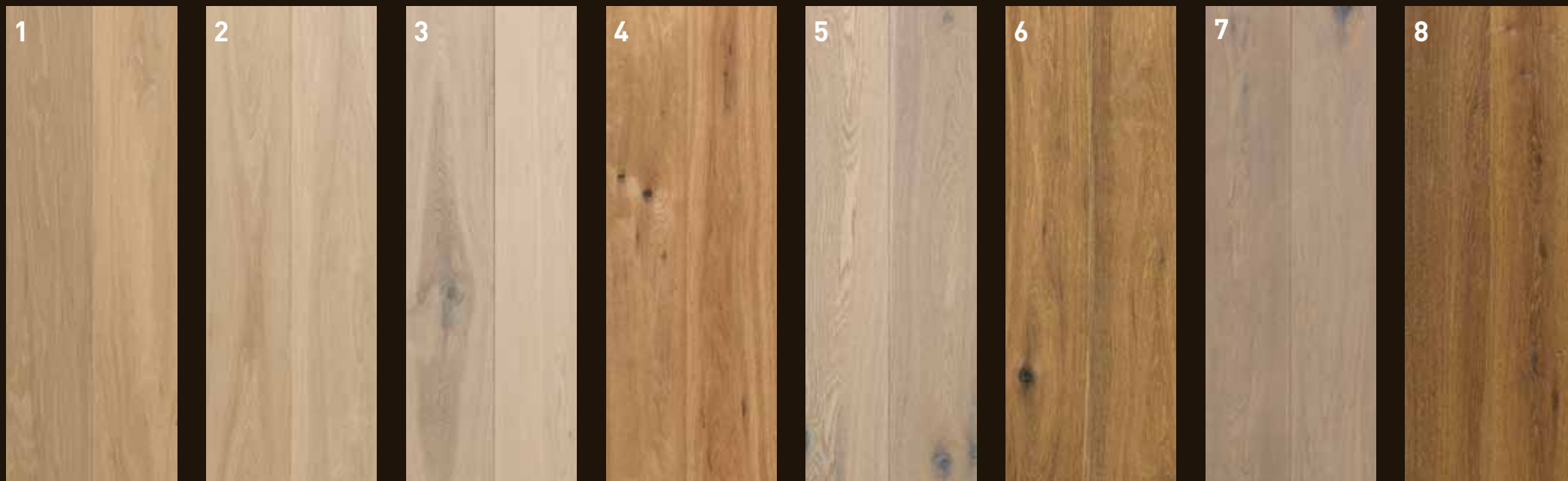
1 Onbehandeld / Non-traité 2 Geolied - onbehandelde look / Huilé, non-traité vision 3 Wit geolied / Huilé blanc 4 Naturel geolied / Huilé naturel 5 Gerookt, wit geolied / Fumé, huilé blanc 6 Gerookt, naturel geolied / Fumé, huilé naturel 7 Dubbel gerookt, wit geolied / Fumé double, huilé blanc 8 Dubbel gerookt, nat. geolied / Fumé double, huilé naturel

Kleuren kunnen afwijken van de gedrukte kleur. Fouten en technische veranderingen voorbehouden. Les teintes réelles peuvent différer des teintes imprimées. Sous réserve d'erreurs ou de changements techniques.