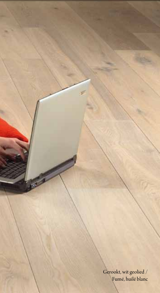
Gerookt, wit geolied / Fumé, huilé blanc