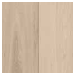
Wit geolied Huilé blanc