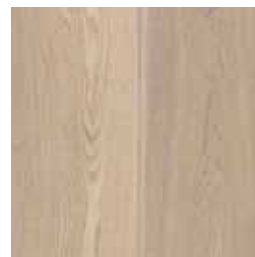
Gerookt, wit geolied Fumé, huilé blanc