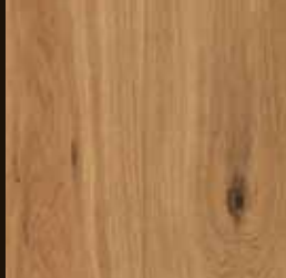
Naturel geolied Huilé naturel