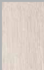
Maritiem grijs Cérusé gris