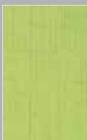
Lounge groen Lounge vert