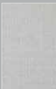
Lounge zilvergrijs Lounge gris argenté