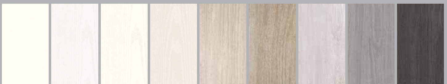
Uni wit Uni blanc Hoogglans wit Blanc brillant Kristal wit Blanc cristal Pergamon Pergamon Atlantic teak Atlantic teak Pacific teak Pacific teak Colonial witgrijs Colonial gris blanc Colonial zilvergrijs Colonial gris argenté Colonial donkergrijs Colonial gris foncé