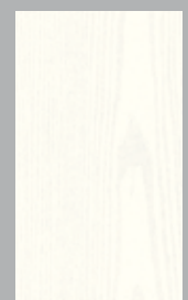
Kristal wit Blanc cristal